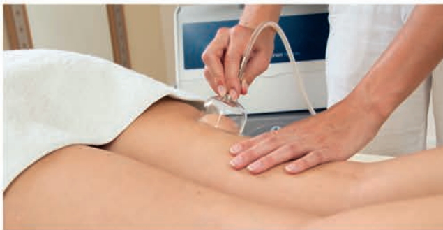
Cellulitebehandlung und Entschlackung